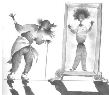
Иллюстрации А. Мартынова

Никогда не мойте руки, Шею, уши и лицо. Это глупое занятие Не приводит ни к чему. Вновь испачкаются руки, Шея, уши и лицо, Так зачем же тратить силы, Время попусту терять. Стричься тоже бесполезно, Никакого смысла нет. К старости сама собою Облысеет голова.