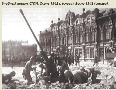
Учебный корпус СППИ. Осень 1942 г. (слева). Весна 1943 (справа).