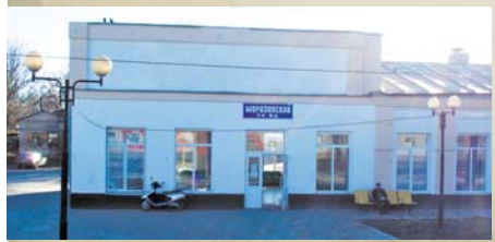
Станция Морозовская, сентябрь 2017 г.