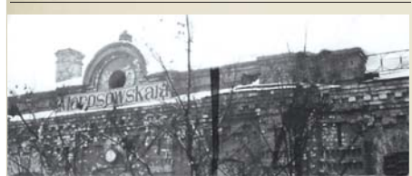
Ж/д вокзал (декабрь 1942 г.)