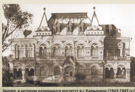
Здание, в котором размещался институт в г. Камышине (1943-1945 гг.).

В тяжелых оборонительных боях Красная Армия отступала. Наступил момент, когда возникла необходимость готовить институт к эвакуации за Волгу. Под непрерывными бомбежками и обстрелами коллектив СППИ проделал большую работу, готовя институт к эвакуации: было уложено и перевезено на берег Волги все хозяйственное имущество, оборудование кабинетов и музеев, книги библиотеки. Но 23 августа во время массированной бомбардировки города все это было уничтожено прямыми попаданиями авиабомбы. В те трагические дни были разрушены все три учебных