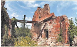
Пункт 138-й стрелковой дивизии — наше время

— На Тракторный? Зачем... Герои еще даже не подозревают, что им необходимо будет заминировать завод, а потом оборонять его как один из самых важных объектов города. В повести переданы страдания Георгия Акимовича, инженера-электрика ТЭЦ, для которого это предприятие было родным детищем, разрушаемым войной. Он участвовал в закладке фундамента завода, с ним связана большая часть его жизни: «На моих глазах выросла ТЭЦ и все эти цехи. Я пять ночей не спал, когда установили генератор номер шесть... Во военные — вам просто жалко завод — и все. А для меня...» — звучит прямая речь этого персонажа. Завод — это детище не только Георгия Акимовича, но и всего Сталинграда. «Он ни на минуту не прекращал работы, в июле завод выпускал по тридцать танков в сутки, а в августе даже до пятидесяти. А сейчас он занимается ремонтом...». Никто не сомневался, как отмечает писатель, что «тракторозаводцы сумеют постоять