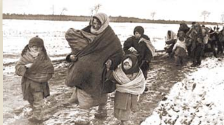
Эвакуация детей из Сталинграда. Осень 1942 г.

История войн еще не знала столь масштабного разрушительного налета. В городе тогда не было скопления наших войск, так что все усилия противника были направлены на уничтожение именно мирного населения.