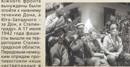
Кадр из фильма «Солдаты» (1956)

Повесть «В окопах Сталинграда» начинается с упоминания о Серафимовиче, моём родном городе. Переживая горечь отступления, молодой офицер Юрий Керженцев — автобиографический герой произведения — делится мыслями: «И ведь совсем недавно только: в мой вступили — двадцатьтого мая, под Терновой, у Харьковова». Но что поделает? «Приказ об отступлении приходит совершенно неожиданно». Автор соблюдает правду факта, удостоверяющего: такой приказ был продиктован жесткой необходимостью военных сражений. «Весной и в начале лета 1942 г., вводя подготовительные операции и добившись серьезных успехов в Крыму и под Харьковом, соединения немецкой группы армий «Юг» захватили стратегическую инициативу. Это дало им, получившим еще и свежие резервы, возможность перейти во второй половине 1942 г. в мощное наступление на кавказском и сталинградском направлениях. В связи с наступлением немцев войска Южного фронта вынуждены были отойти к нижнему течению Дона, а Юго-Западного за Дон, к Сталинграду». А 17 июля 1942 года фашисты вышли на территорию Сталинградской области. Передовым немецким отрядам противостояли наши «истрепанные в боях части. 304