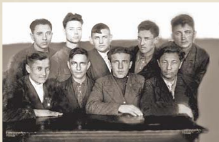
Выпускники исторического отделения учительского СППИ 1941 г., увидевшие на фронте