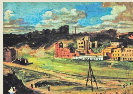
А. Мызин. «Сталинград 1944 года». 1944.

Дети Сталинграда: 10 лет после войны. Воспоминания жителей города / редкол.: М. А. Рыблова (гл. ред.), Т. П. Хлынина, Е. Ф. Криноко [и др.]. — Волгоград: Изд-во Волгоградского филиала ФГБОУ ВПО РАНХиГС, 2015. — 359 с.: [8] л. фот. — (70 лет победы в Великой Отечественной войне). Книга является продолжением сборника «Дети и война: Сталинградская битва и жизнь в военном Сталинграде в воспоминаниях жителей города». Во время сбора материала для этой книги дети военного Сталинграда, большинство из которых сейчас уже более 70 лет, вновь погружались в свое тяжелое, опаленное войной детство, однако на этот раз они концентрировали свое внимание на десяти годах, прошедших после войны и старались ответить на вопросы: как повлияла война на их детство, на жизнь и судьбу в целом, какими собственно детскими способами они преодолевали ее последствия. Воспоминания «детей Сталинграда» записывали в 2012-2015 гг. студенты и сотрудники Волгоградского государственного университета; методологическое обеспечение и общее руководство опросом осуществляли преподаватели ВолГУ и сотрудники Южного научного центра РАН в рамках проекта РФНФ «Дети и война: культура повседневности, механизмы адаптации, стратегии и практики выживания в условиях Великой Отечественной войны».