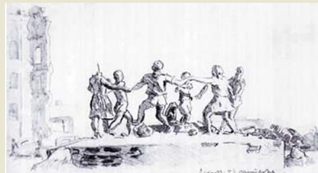
Евгений Кибрик. Фонтан у вокзала. Из серии «Сталинград. Сентябрь». 1943