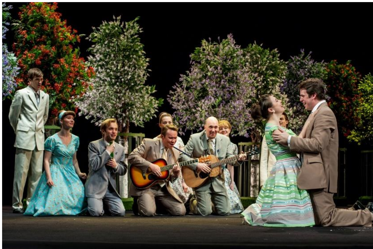
Рис. 18. Сцена из спектакля «Прощание в июне».

молодого поколения. Он переходит в его веру: всё продаётся и всё покупается, важна цена и цель.