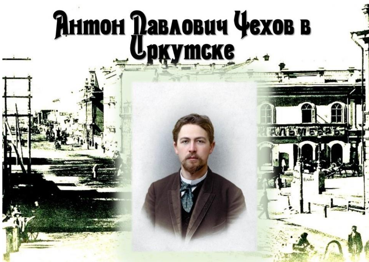
Рис. 2. А.П. Чехов в Иркутске 2

Событием культурной жизни Иркутска стало рождение в 1994 году фестиваля «Сияние России». В Иркутск приезжают на фестиваль известные поэты и писатели из других российских городов.