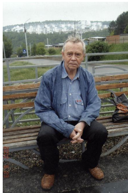
Рис. 7. В.Г. Распутин в Иркутске. 2012 г. 7

1958 г. 6