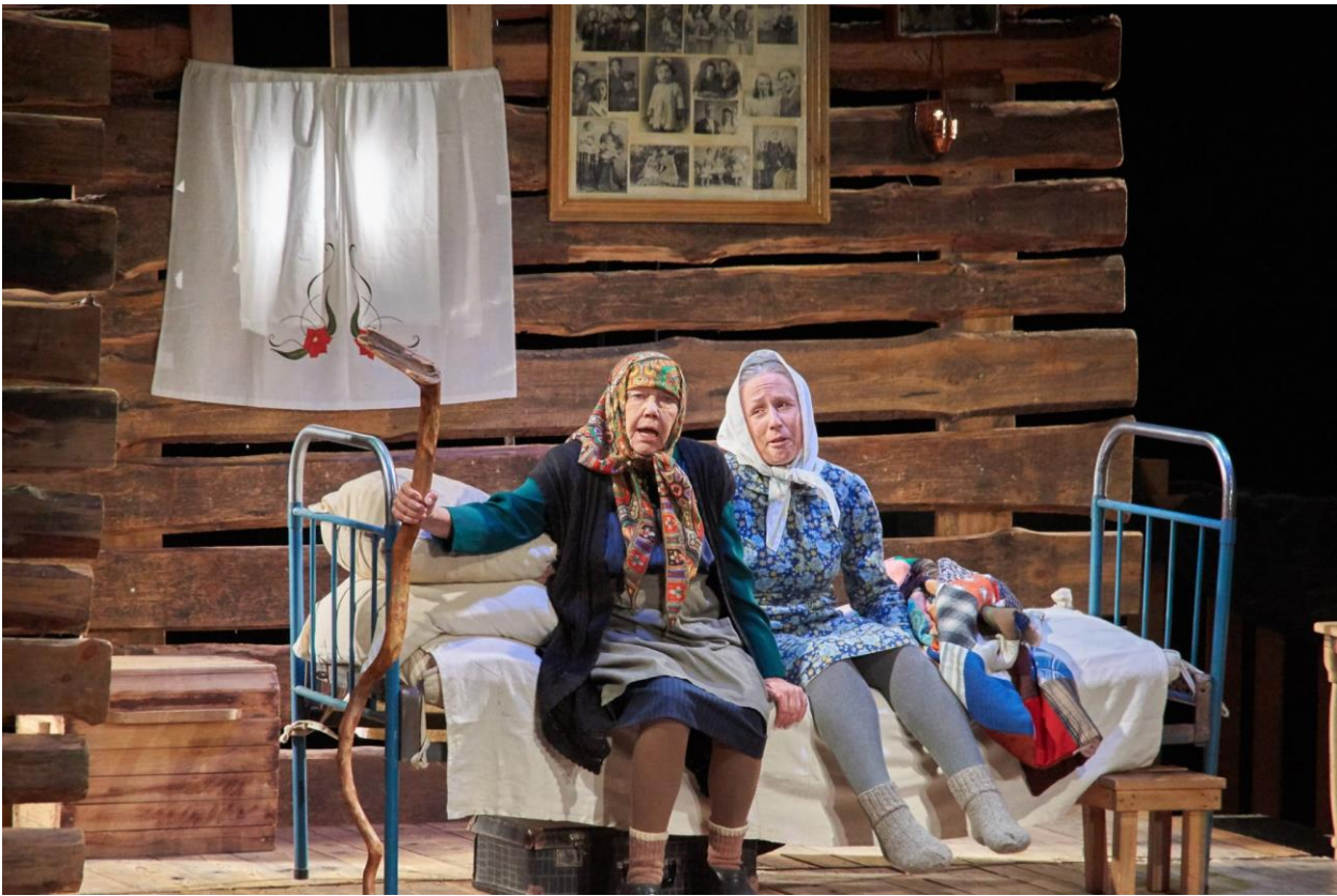
Рис. 4. Спектакль по мотивам повести «Последний срок».

Сцены из деревенской жизни в двух действиях, инсценировка и постановка Семена Лосева 4