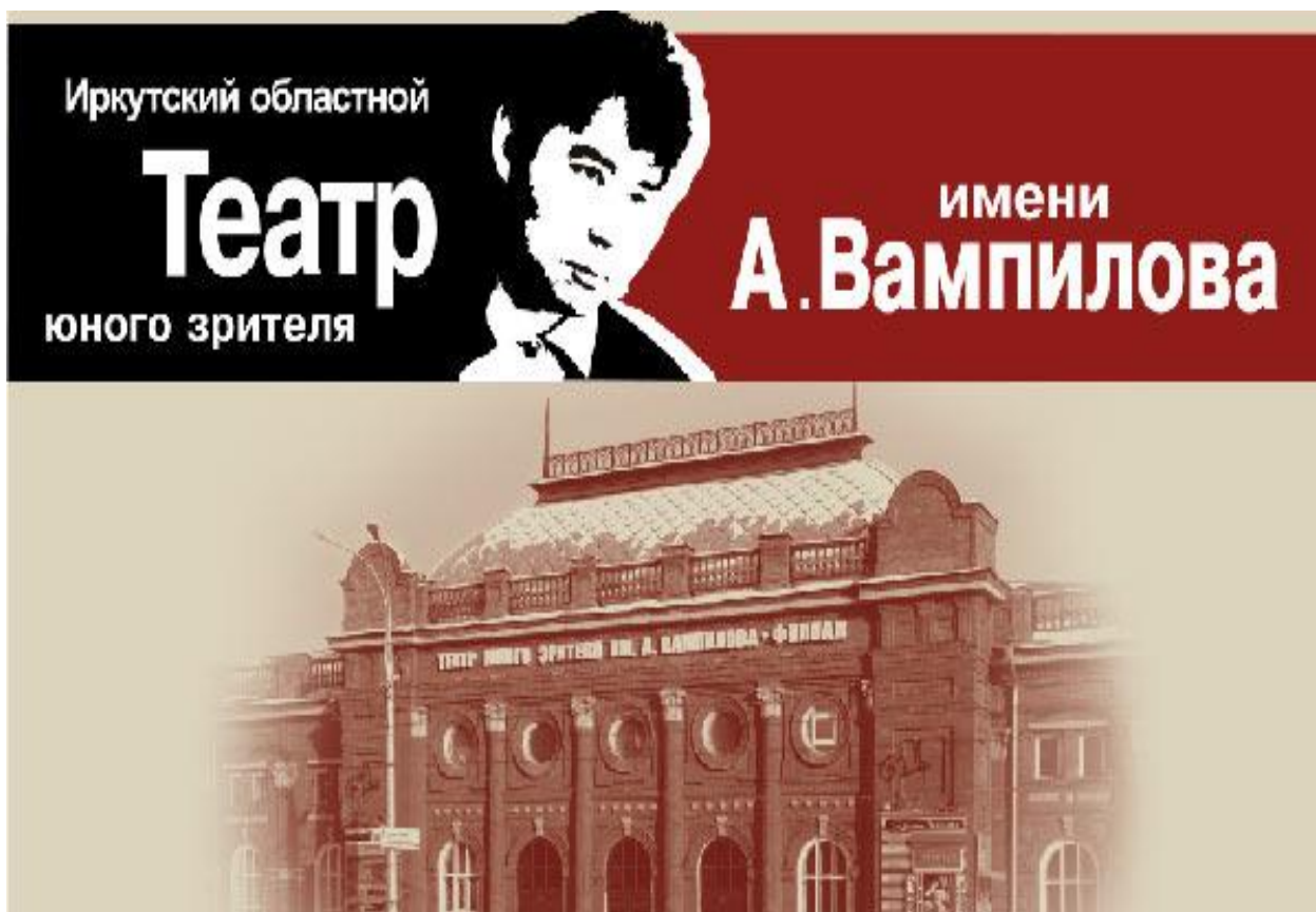
Рис. 16. Иркутский областной театр имени А.В. Вампилова в Иркутске 17