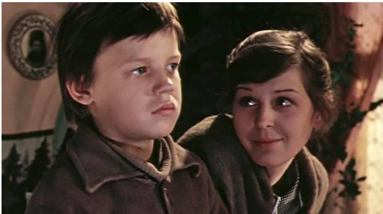
Рис. 9. Кадр из фильма «Уроки французского» (1973 г.) 10

Она сидела передо мной аккуратная, вся умная и красивая, красивая и в одежде, и в своей женской молодой поре , которую я смутно чувствовал, до меня доходил запах духов от неё, который я принимал за самое дыхание; к тому же она была учительницей не арифметики какой-нибудь, не истории, а загадочного французского языка, от которого тоже исходило что-то особое, сказочное, неподвластное любому-каждому, как, например, мне. Не смея поднять глаза на неё, я не посмел и обмануть её. Да и зачем, в конце концов, мне было обманывать?