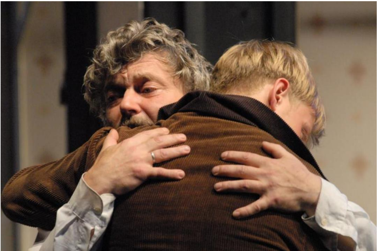
Рис. 17. Сцена из спектакля «Старший сын».

Иркутский драматический театр им. Н.П. Охлопкова 18