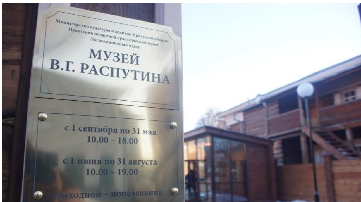
Рис. 8. Музей В.Г. Распутина 8

Любовь и преданность Иркутску – в делах Валентина Григорьевича. Его хлопоты о новом здании библиотеки им. И.И. Молчанова-Сибирского, о повседневных нуждах Православной женской гимназии во имя Рождества Пресвятой Богородицы, о восстановлении памятника Александру III, о десятках других дел, важность которых пронизательно видел только он, дали городу культурные центры. Это то, что будет стоять долгие годы, и будет нести в себе теперь и память о писателе.