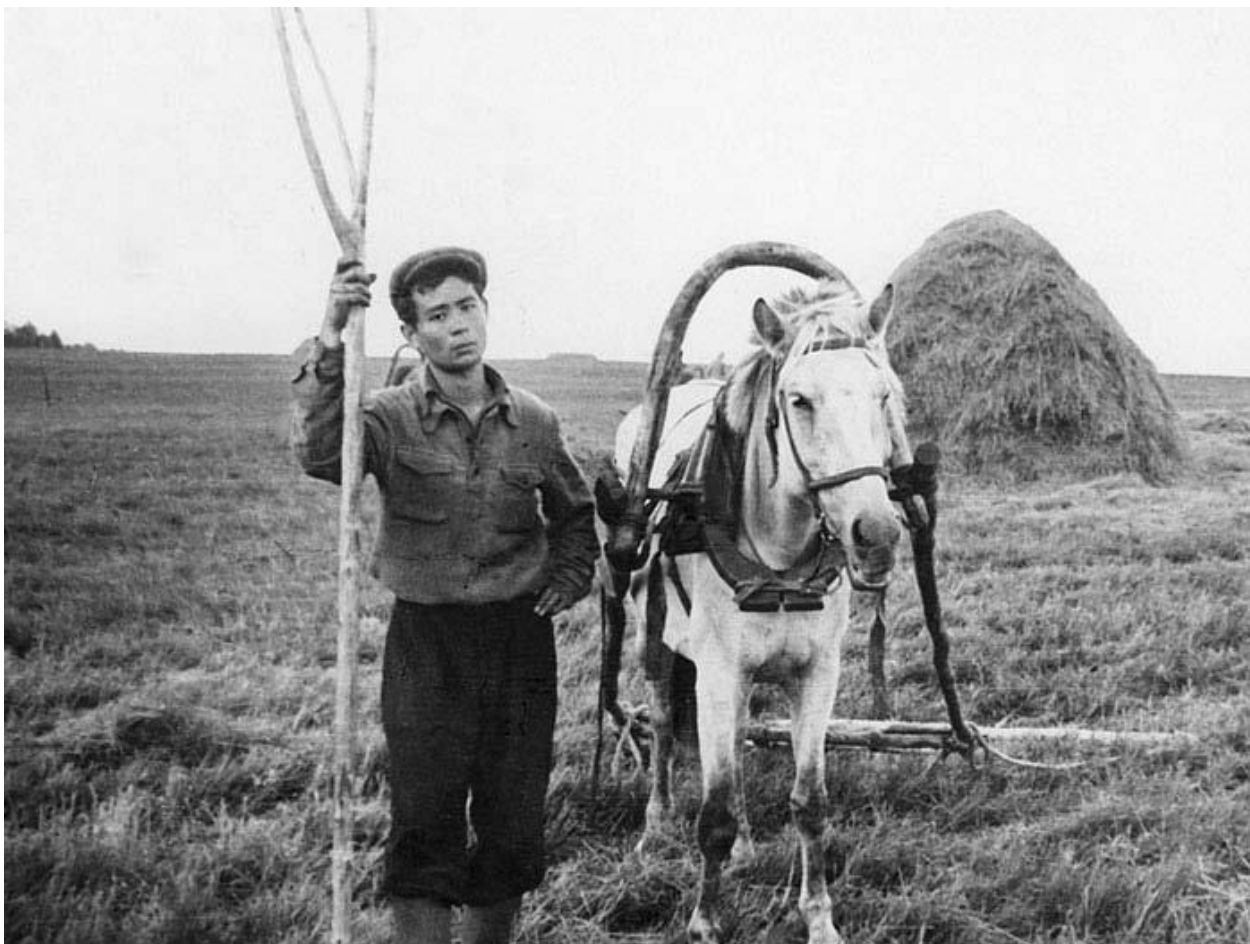
Рис. 12. А.В. Вампилов в родном селе Кутулик 13

Пьесы «История с метранпажем» и «Двадцать минут с ангелом» составили трагикомическое представление в 2 частях «Провинциальные анекдоты».