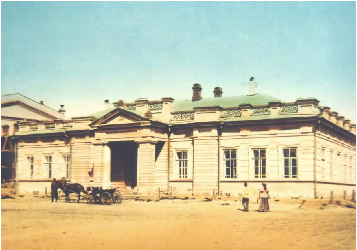
Рис. 1. Первая Публичная библиотека в Иркутске 1

Конец 19 века – это время появления в Иркутске больших книжных магазинов. В 1920 году на берегу Ангары родилось первое литературно-художественное объединение «Барка поэтов». Известными стали имена Иосифа Уткина, Ивана Молчанова-Сибирского, Георгия Ржанова.