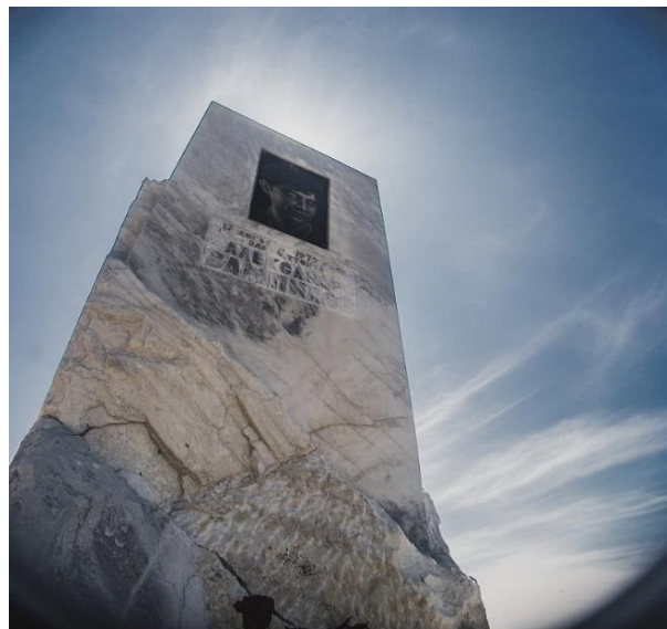
Рис. 14. Памятник А.В. Вампилову 15

А.В. Вампилову на месте гибели на Байкале в посёлке Листвянка 14