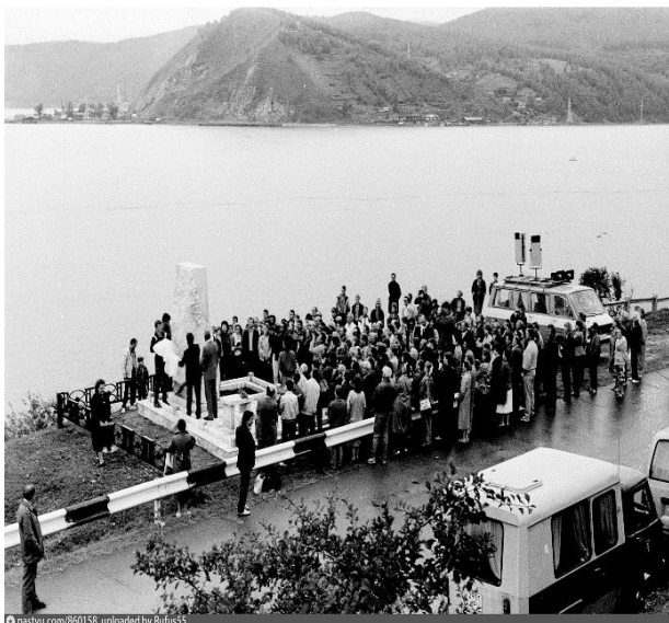
Рис. 13. Открытие памятника

А.В. Вампилову на месте гибели на Байкале в посёлке Листвянка 14