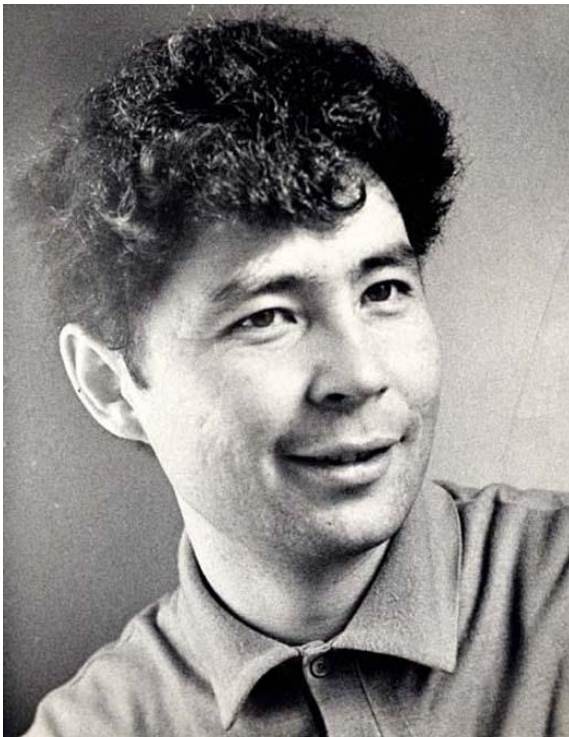
Рис. 10. Александр Вампилов 11