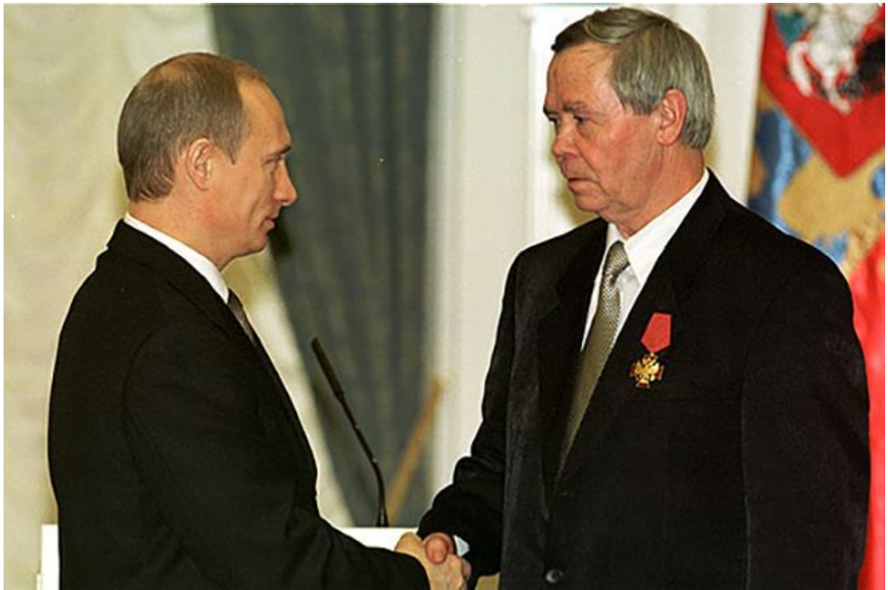
Рис. 5. Валентин Распутин и Владимир Путин 5

Результатом творчества и общественной деятельности писателя стали более 20-ти различных правительственных премий и наград в области литературы, культуры и просвещения. По произведениям Валентина Распутина в разные годы было поставлено множество спектаклей и снято порядка 10-ти художественных фильмов.