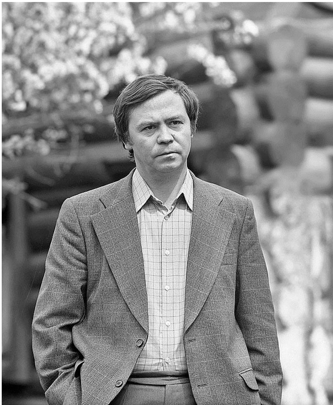
Рис. 3. Валентин Распутин 3