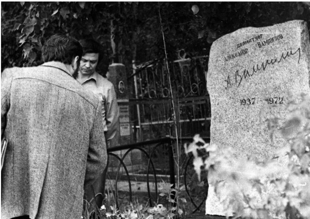
Рис. 15. Валентин Распутин на могиле Вампилова в Иркутске.

Валентин Распутин так сказал о Вампилове: «Вместе с Вампиловым в театр пришли искренность и доброта – чувства давние, как хлеб, и, как хлеб же, необходимые для нашего существования и для искусства.